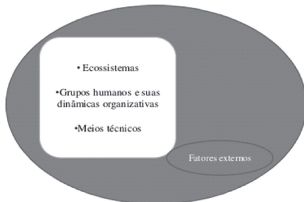
Figura 1 – Componentes para análise de um sistema agrário

quais sejam: ecossistema, grupos humanos, meios técnicos e fatores externos.